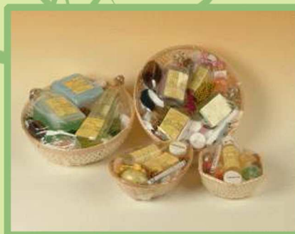
cesta de regalo

Recuerda, en Esencia Oliva te ofrecemos la posibilidad de enviarlo donde nos digas y de que lo puedas personalizar.