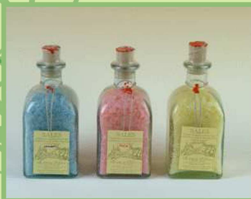
Salas de baño

Especiales para combatir el estrés y lograr un placentero descanso.