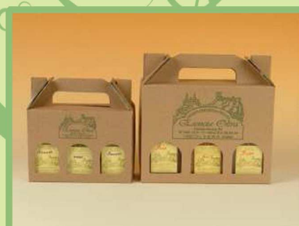
estuches de regalo